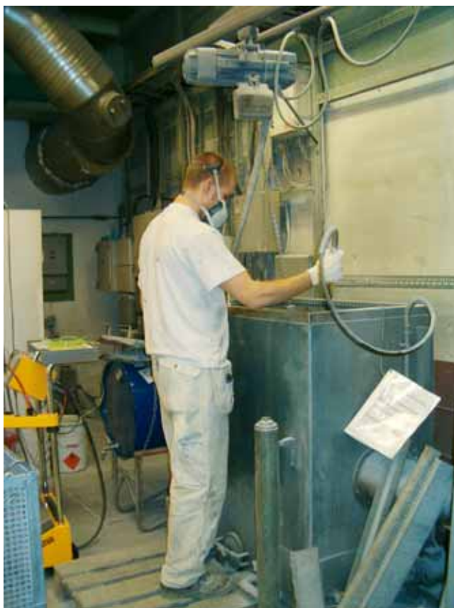
Avfettning i en mindre anläggning. Här används trikloretylen (tri) som avfettningsmedel.

De medföljande inspektörerna från Kemikalieinspektionen noterade leverantörsuppgifter för de avfettningsmedel som användes, information om produktens senaste inköpsdatum samt uppenbara brister i säkerhetsdatabladen och märkningen. Även frågor om användarnas informationsbehov och om arbetsplatsen fick säkerhetsdatabladen senast vid första leverans, noterades.